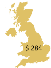
Comercio Exterior 2018 con Reino Unido